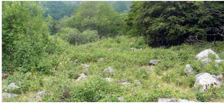
Carlina à longues feuilles

Recolonisation de la coulée de boue par les ligneux