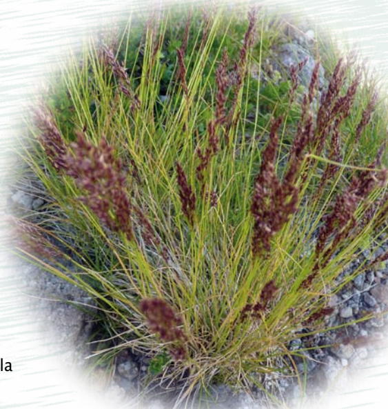
Agrostide des rochers

Pour les zones où le recouvrement est plus important on trouve l'Arnica des montagnes, la Renouée bistorte et la Potentille dorée.