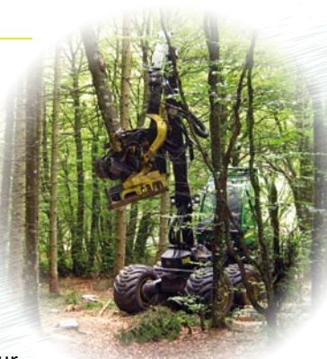
Abatteuse au travail

Plusieurs des objectifs du plan de gestion de la réserve concernent la forêt dont celui qui prévoit de « Tendre à éliminer l'épicéa introduit sur la réserve ». C'est dans ce cadre qu'une éclaircie a été réalisée dans la pessière située à l'entrée de la réserve en 2011. 200 m 2 d'épicéas ont été abattus en favorisant les hêtres présents. Pour des raisons de sécurité, la parcelle est en bordure du chemin d'accès au cirque, une abatteuse a réalisé le travail pour réduire au maximum la durée du chantier. Cette première opération sera reconduite afin qu'à terme les hêtres reprennent leur place.