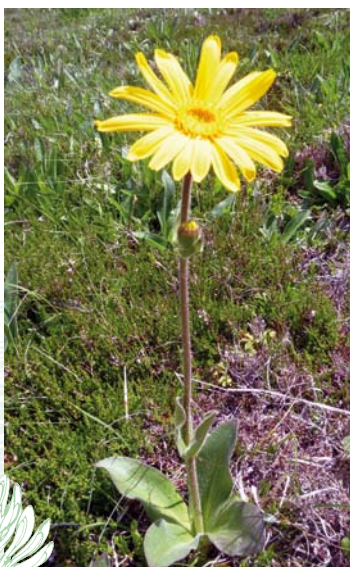
Arnica des montagnes