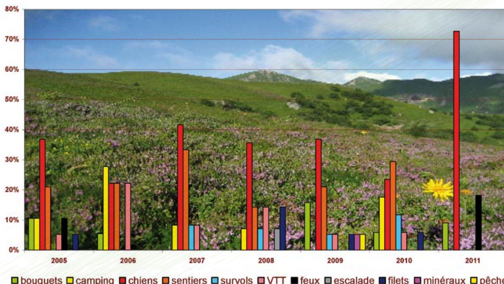
Constatations des infractions

La police de l'environnement est assurée par le conservateur, le garde technicien et les gardes nature du Parc sur les crêtes avec un renfort ponctuel du Peloton de Gendarmerie en Montagne sur le bas de vallée. Les infractions constatées sont pour les 3/4 des entrées sur la réserve avec des chiens. Le nombre de randonneurs en dehors des sentiers a baissé. Les personnes en infraction n'ont pas été verbalisées, elles ont été averties et ont dû se mettre en conformité avec la réglementation.