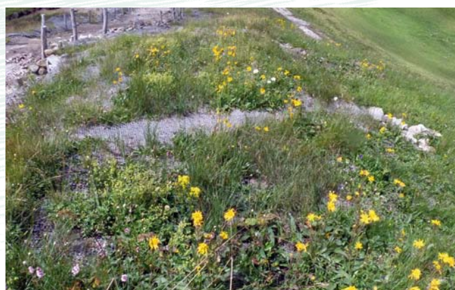
Parcelle ré-engazonnée du chemin du puy de la Perdrix