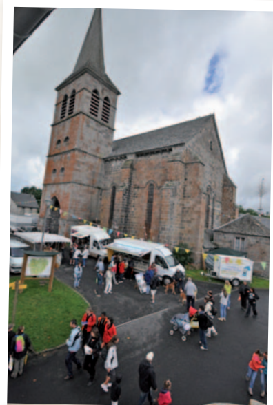
Concours AOP St-Nectaire en 2014 où la réserve tenait un point d'information

la réserve lors des conseils municipaux et des différentes réunions dans le bourg. Il me semble qu'un effort est à poursuivre envers les habitants de Chastreix. La réglementation de la réserve est connue à présent mais à l'inverse, l'accompagnement de la réserve sur les démarches et les possibilités de projet pouvant être réalisées, le sont beaucoup moins. Le dialogue entre la réserve et les habitants de Chastreix doit se poursuivre et permettre des actions en commun. »