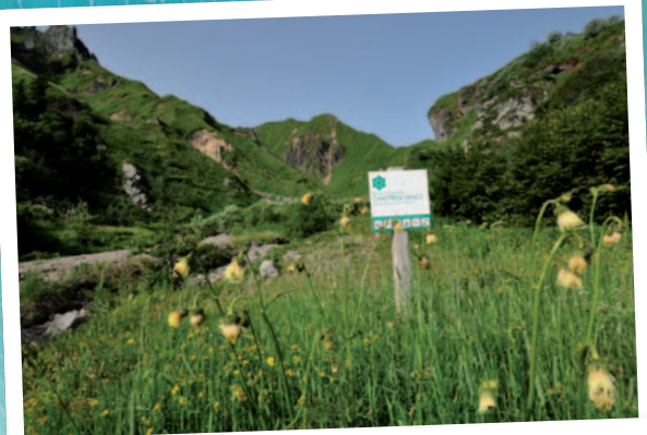
Le Val d'Enfer

Ces chiffres sont donc très satisfaisants pour une réserve naturelle classée récemment. Un effort est en revanche à réaliser auprès des jeunes puisqu'ils sont seulement 35% parmi les écoliers et 42% parmi les collégiens à dire connaître la réserve. Des animations (visites sur site et en classe, expositions...) sont envisagées pour aller à la rencontre des jeunes publics.