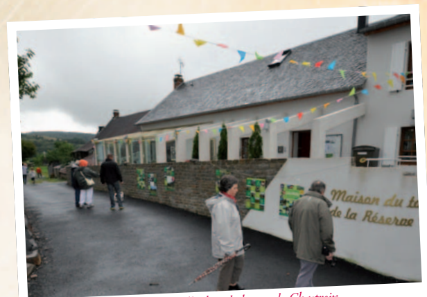
La maison de la réserve naturelle dans le bourg de Chastreix