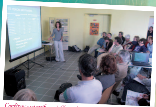
Conférence scientifique à Chastreix en 2011

Trois habitants sur quatre connaissent l'existence de la maison de la réserve, mais peu d'entre eux l'ont visitée. Ouverte en juin 2013, cette maison a vocation à accueillir largement dans un espace adapté et convivial. L'aménagement d'un espace muséographique permanent et d'expositions temporaires, l'organisation de rencontres et d'animations devraient permettre de créer un réel espace de vie et d'échanges.