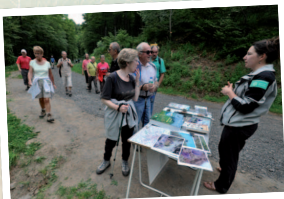
Point d'information lors de la balade du journal en juin 2014