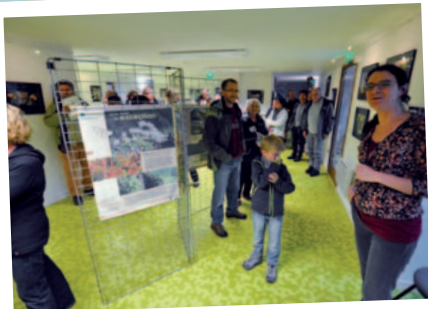
Inauguration de l'exposition « Auvergne en fleur » en juillet 2014

36% ont déjà rencontré un membre du personnel de la réserve.